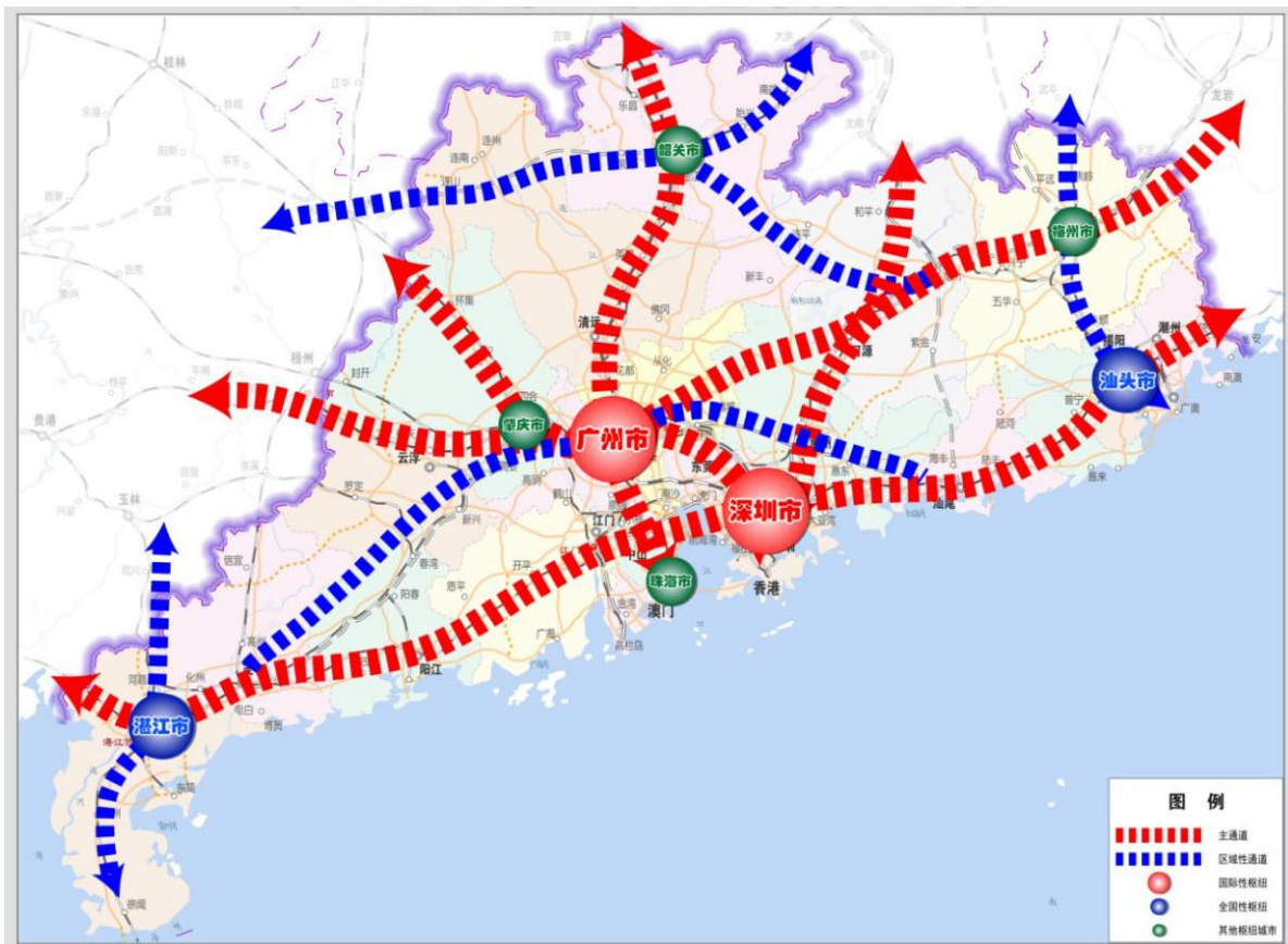
图3 广东省综合运输通道布局示意图

完善便捷高效的区域交通网。 提升广州、深圳国际性综合交通枢纽竞争力，统筹珠江口西岸综合交通枢纽规划布局，加快粤港澳大湾区城际铁路建设，打造“轨道上的大湾区”，推进深中通道、狮子洋通道、黄茅海跨海通道、莲花山通道建设，构建以广佛—港深、广佛—澳珠以及珠江口跨江通道为主轴，覆盖中心城市、重要节点城市、主要城镇的大湾区城际快速交通网络。强化汕头、湛江全国性综合交通枢纽功能，提升韶关综合交通枢纽能级，加快建设粤东城际铁路网，建设汕头澄海至潮州潮安、湛徐高速乌石支线、信丰（省界）至南雄高速公路，提升汕头、湛江、韶关等市对周边地区的辐射水平。完善覆盖广泛、通畅便捷