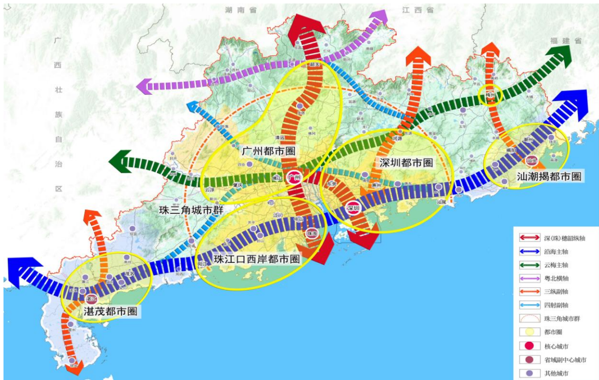
图4 广东省城镇化空间格局示意图